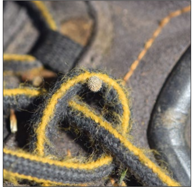
Abb. 11: Anhängliche Frucht des Kletten-Labkrauts ( Galium aparine ) – 2018 auf meinem Botaniker-Schuhband