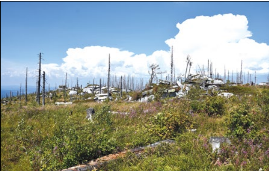
Abb. 23: Großflächig abgestorbene Hochlagen-Fichtenwälder 2018 im Dreiländereck am Plöckenstein – ein junger Wald beim Neustart (DUNZENDORFER U. HOHLA 2014)