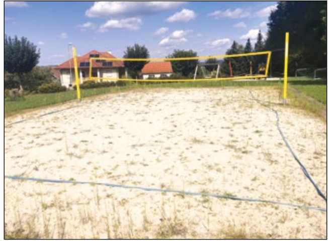
Abb. 14: Scheinbar verwaister Beachvolleyball-Platz 2024 in Gamschdorf im Burgenland – auf dem Weg zum Grünstreifen