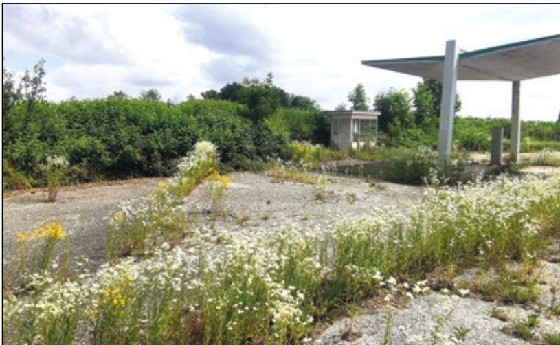
Abb. 19: Eine innerhalb von eineinhalb Jahren (!) mit vielen blühenden Pflanzen übersäte (!) Tankstelle 2024 in Andorf