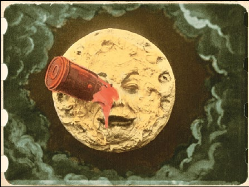
Abb. 4: Einzig erhalten gebliebener Farbdruck des Films Le voyage dans la lune (1902) von Georges Méliès