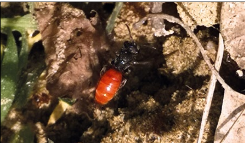
Abb. 5: Viele Wildbienen brauchen offenerdige Stellen zum Nisten – wie hier eine Blutbiene ( Sphecodes sp.) 2021 in den Steilhängen der Salzach bei Hochburg-Ach.