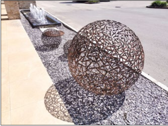
Abb. 17: Höchste Graustufe – innerhalb einiger Jahre wäre wohl auch dieser Vorplatz grün, wenn man ihn ließe – in der Mitte drei perfekte potentielle Wild Bullets (im Sinne Lois Weinbergers)!