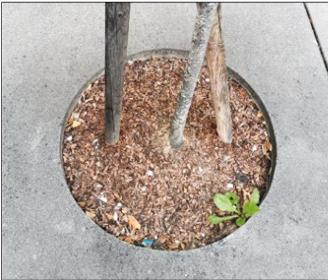
Abb. 27: Eine runde Sache – Baumscheibe mit Löwenzahn ( Taraxacum sp.) als Kontrapunkt – 2024 in Ried im Innkreis