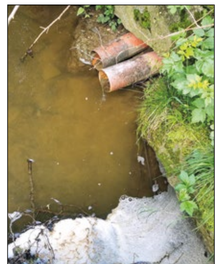
Abb. 3: Eines der vielen hochwasserver-schlimmernden Drainagerohre – hier 2024 in Aubach – sie tragen außerdem auch verunreinigtes Wasser in die Bäche.

werden Millionen verbaggert!“, oft nicht wissend, dass es zu ihrem eigenen Schutz gemacht wird und dass es nur die logische Konsequenz ist nach den groben Fehlern der Vergangenheit. Hätte man nicht Häuser und Felder so nahe zu den Gewässern gebaut und hätte man nicht die Bäche derartig begradigt und im Oberlauf die feuchten Wiesen trockengelegt (Abb. 3), wären diese Anlagen wohl nie notwendig ge-