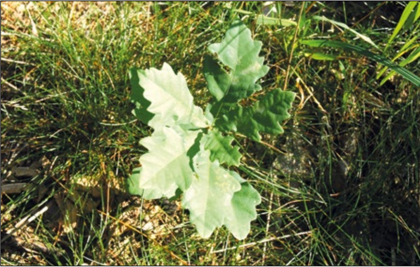
Abb. 22: Erfolgreiche Naturverjüngung in einem Wald 2007 nahe Zell an der Pram – eine junge Eiche hofft auf ein langes Leben unter ihresgleichen.