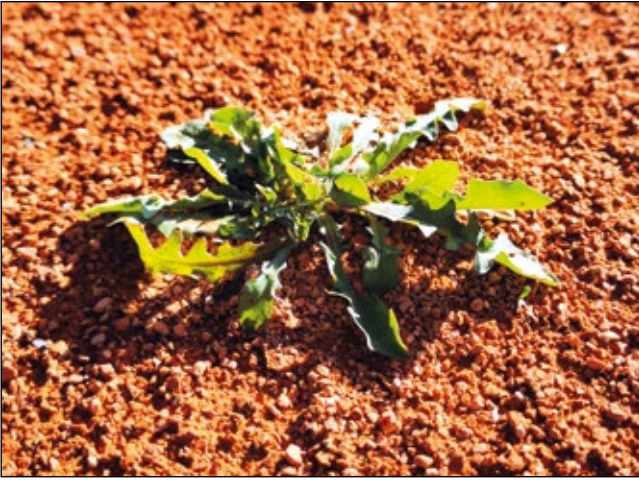
Abb. 13: Ein Löwenzahn ( Taraxacum officinale agg.) auf dem Sand – einer der vielen Fallschirmponiere 2024 auf dem Tennisplatz in Obernberg am Inn – gelandet mit dem Auftrag, sich vor dem Spiel per Hand entfernen zu lassen