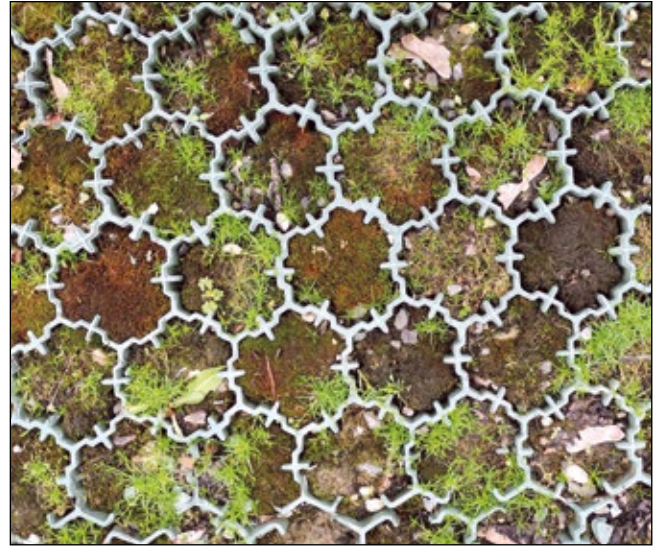
Abb. 26: Meditative Elemente auf dem Boden der Realität – 2023 auf einem Parkplatz in Judenburg – mit Moosen, geflügelten Ahornsaamen und Liegendem Mastkraut ( Sagina procumbens )