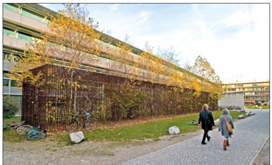
Abb. 29: Lois Weinberger „Wild Cube – eine poetische Feldarbeit“, 1991–1998, Rippenstahl, Spontanvegetation, 40 x 4 x 3,7 m, Fakultät für Sozial- und Wirtschaftswissenschaften der Universität Innsbruck

Die positive Spannung, die sich dadurch im Übergangsbereich zwischen Kultur und Natur ergibt, dort, wo die beiden einander nach LATOUR (2017)