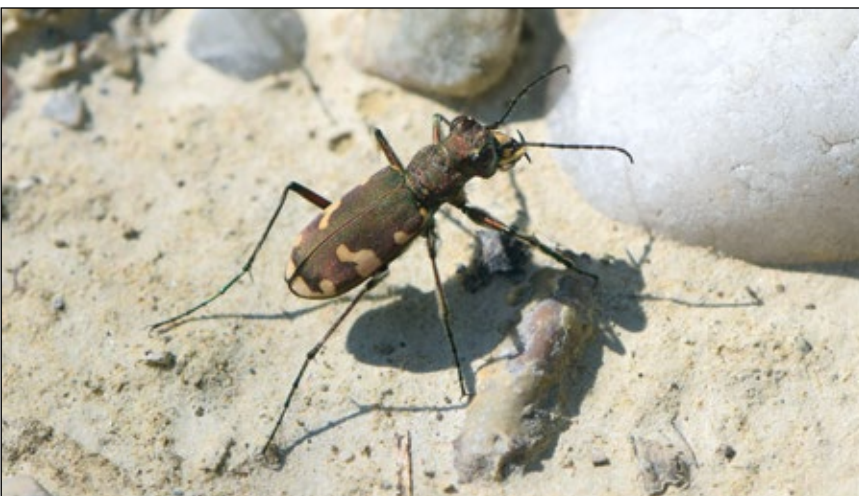
Abb. 6: Auch Sandlaufkäfer sind auf offene, besonnte Flächen angewiesen – hier der Berg-Sandlaufkäfer ( Cicindela sylvicola ) 2021 in einer Schottergrube in Gilgenberg am Weilhart

worden. Auch nicht wegen der vermehrten Starkregenereignisse aufgrund der zunehmenden Erderwärmung (IPCC 2022)!