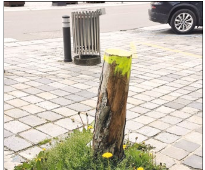
Abb. 28: Baumscheibe ohne Baum 2023 in Judenburg – trotzdem ein Blickfang!

warten, was kommt; einfach vertrauen, dass die Natur genug zu bieten hat. Ähnlich wie Lois Weinberger mit seinen „Wild Cubes“ (Abb. 29) kann man Flächen in Gärten, in Parkanlagen oder Innenhöfen dafür vorsehen oder sogar einzäunen und warten. Jeder Neuankömmling darf begrüßt und gefeiert werden, egal ob heimisch oder fremd. Nach Weinberger sind dessen Wild Cubes-Arbeiten „gegen die Ästhetik des Reinen und Wahren, gegen ordnende Kräfte“ (VAN CAUTEREN 2013). (Bei öffentlichen Flächen ist jedoch eine Information für die Passant*innen hilfreich, um sie über Sinn und Hintergrund der Aktionen zu informieren.)