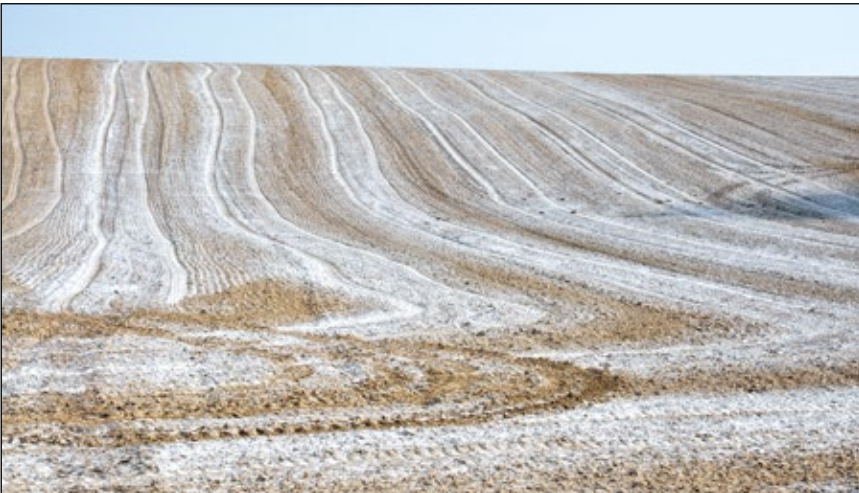
Abb. 9: Frisch gekalkter Acker bei Taufkirchen an der Pram im April 2012 – von der nackten Erde bis zur Erntereife – quasi von 0 auf 100 – in nur wenigen Wochen bzw. Monaten

Robert Walser (WALSER 1990) etwa, ist aus einigen Metern Abstand gesehen eine graue Fläche. Ein unbeschriebenes Blatt Papier hingegen, ist unter dem Mikroskop betrachtet eine raue, unruhige, ja fast wilde Landschaft ... und scheinbar weißes Papier ist außerdem ganz und gar nicht weiß, wie der japanische Autor und Designer Kenya Hara uns tiefsinnig vermittelt (HARA 2009).