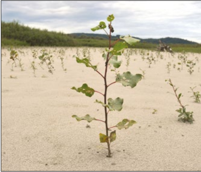
Abb. 25: Zahllose junge Schwarz-Pappeln ( Populus nigra ) und Weiden ( Salix spp.) auf frischem Innschwemmsand – in der Hagenauer Bucht im September 2013 – heute bereits ein dichter Auwald!