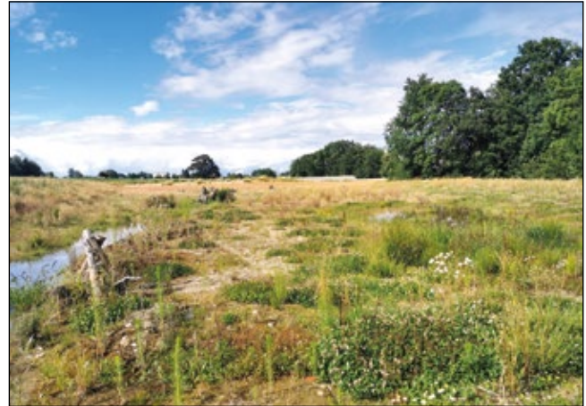
Abb. 2: Das Rückhaltebecken Aubach im Juli 2024 – ein gelungenes Paradies für Pioniere unter den Pflanzen und Tieren – später dann ein wertvoller Auwald mit Feuchtbiotopen

Vergangenes Jahr wurde ich zu einer Baustelle am Rand der Stadt Ried im Innkreis gebeten, um meine Meinung als Biologe kundzutun. Es war im Rahmen eines Pressetermins, der einberufen wurde, weil Menschen sich über die hässliche „Mondlandschaft“ beschwert hatten, die sich beim Bau des Rückhaltebeckens Aubach ergab. Man beklagte sich bezeichnenderweise nicht über eine völlig versiegelte Innenstadt und auch nicht über die vielen neuen Hallen, Parkplätze und Wohnanlagen auf besten Ackerböden. Nein, es war die Tatsache einer vor großem Schaden bewahrenden und zugleich ökologisch nützlichen Geländeumformung, ein Win-Win-Projekt sozusagen, bei der vorübergehend großflächig Erde freigelegt wurde. Es folgt nun der Versuch einer psychologischen Betrachtung unserer Nervosität, die sich beim Anblick solcher nackten Böden oft einstellt, in gewisser Hinsicht ein „Horror vacui“!