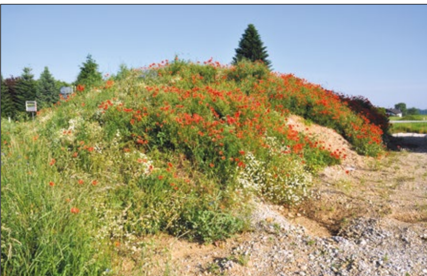
Abb. 24: Ein Blütenhügel 2013 auf einer Baustelle nahe Hochburg-Ach im Innviertel – Augenblick, verweile doch, du bist so schön!

von selber kommt. Von allen Seiten werden diese bedrängt, doch etwas zu tun, aufzuräumen und aufzuforsten. Die wohl wichtigste Frage, die sich ihnen in der heutigen Zeit stellt, ist, welche Baumarten ein „klimafitter“ Wald aufweisen soll. Nach den vielen Kahlschlägen aufgrund der Käferproblematik und den schweren Sturmschäden muss es zu einer Grundsatzentscheidung kommen: Aufforstung oder/und Naturverjüngung? Letzteres bedeutet, dass man die von selber aufgehenden jungen Bäumchen vor Wildverbiss schützt und in den Folgejahren durch Auslichten in Richtung Zukunfts-Mischwald begleitet. Vielleicht ist die Methode der Naturverjüngung die klügere und auch nachhaltigere; auf jeden Fall ist sie die kostengünstigste Form der Waldverjüngung (BFW 2024). Bäume, die von selber kommen, haben einen bedeutenden Startvorteil, weisen in der Regel einen größeren Genpool auf im Vergleich zur Baumschulware und ... sie passen ökologisch gut auf den selbsterwählten Standort (Abb. 22 u. 23). So richtig schlau wird man jedoch erst nach Jahrzehnten. Das gilt aber auch für einen Kunstwald!