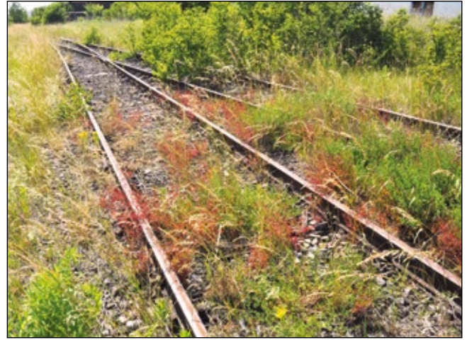
Abb. 18: Auf wundersame Art und Weise verwachsene Nebengleise 2014 auf dem Bahnhof Simbach am Inn in Niederbayern – aus der Nutzung genommen, jedoch nicht aus dem Sinn!