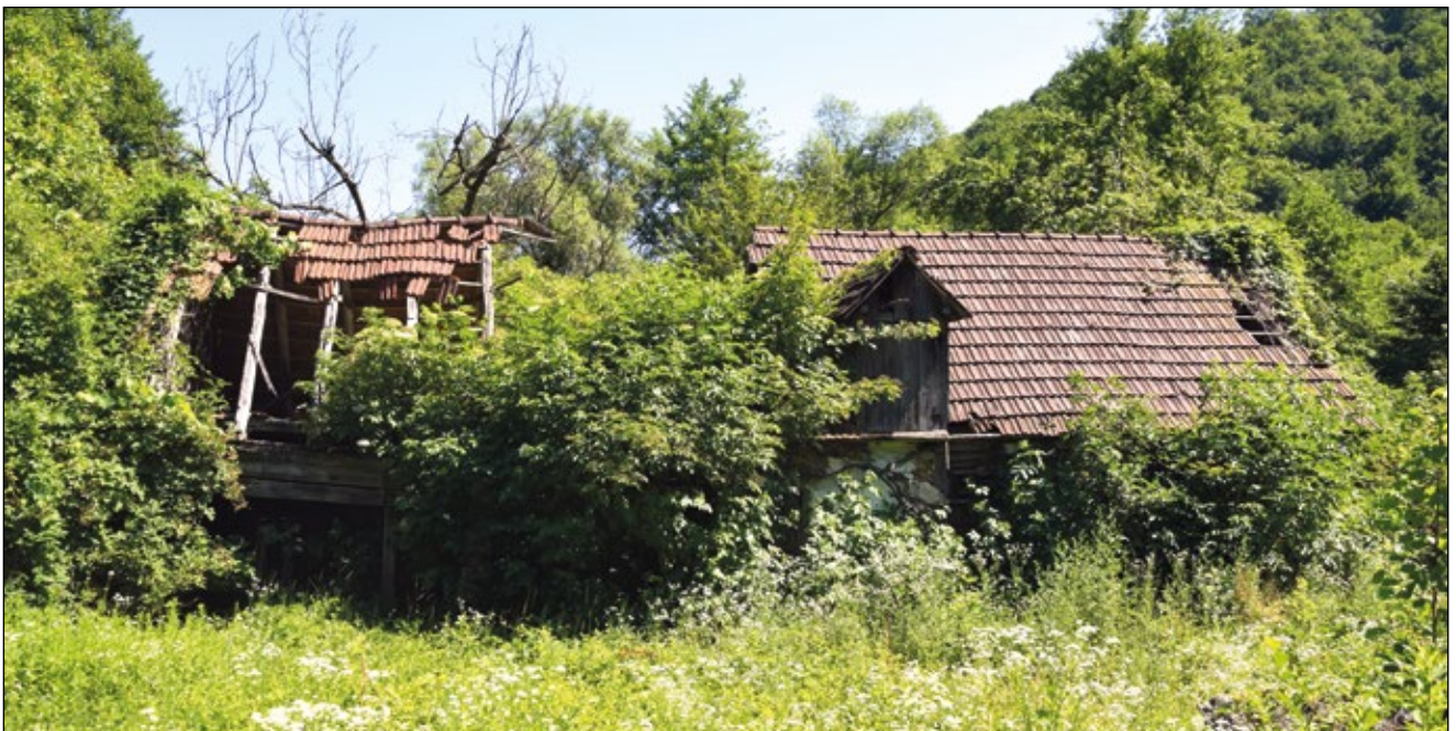
Abb. 21: Verlassener und von der Natur bereits rückeroberter Bauernhof 2019 nahe Rujevac in Kroatien