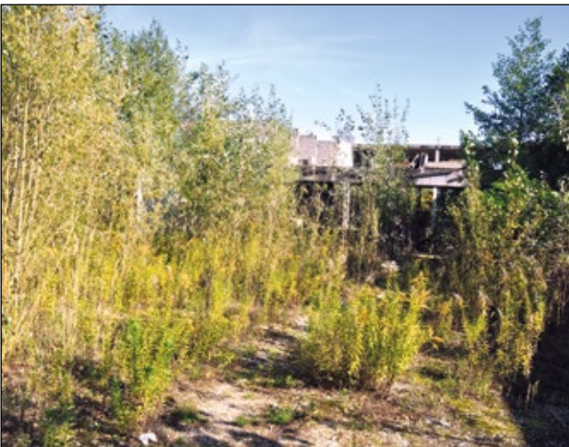
Abb. 15 u. 16: Die „Reha-Ruine“ in Obernberg am Inn im Jahr 2012 und 2022 – nach zwei Jahrzehnten des ungeplanten In-sich-Ruhens quasi ein Birken-Pappeln-Weiden-Goldruten-Urwald und zugleich ein Kunstobjekt