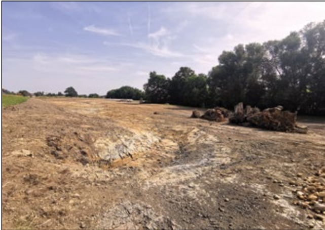
Abb. 1: Für manche ein brutaler, schwer auszuhaltender Anblick – die frische Baustelle des Rückhaltebeckens Aubach im Juni 2023 in Ried im Innkreis

Therese-Riggle-Straße 16 A-4982 Obernberg am Inn m.hohla@eduhi.at