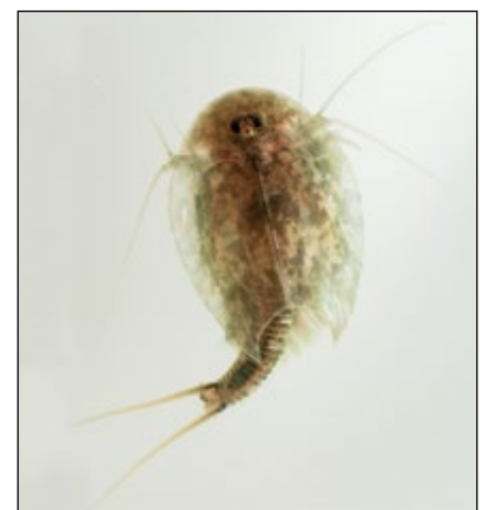
Abb. 12: Der Sommerschildkreb ( Triops cancriformis ) – ein „Urzeitkreb“ aus den March-Auen bei Marchegg – bildet erstaunliche Dauerformen.

ersten Blick absolut nichts davon erkennen kann, nur halt in anderer Form, denn auch ein keimfähiger Same oder ein noch nicht völlig ausgetrocknetes Stück Holz ist, genau genommen, ein lebender Organismus. Manche Tiere bilden ebenfalls interessante Dauerformen. Dazu gehören zum Beispiel die Urzeitkrebse (Abb. 12), deren „Dauereier“ (Zysten) bis zu 20 Jahre im trockenen Boden warten und eine neuentstandene Wasserlache oder eine Ackersutten in Rekordzeit besiedeln können (EDER u. a. 2014, SCHERNHAMMER 2020). Sogar Wüstenböden sind nach Jahren der Trockenheit plötzlich nach Regenereignissen auf wundersame Weise von einem Blütenmeer bedeckt. Und Überschwemmungsgebiete sind