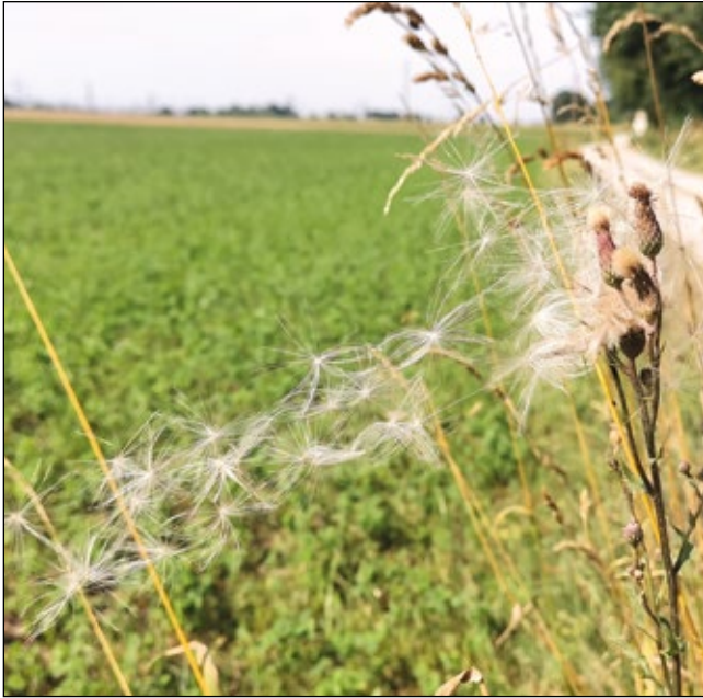
Abb. 10: Dutzende kleine Fallschirme der Acker-Kratzdistel ( Cirsium arvense ) lösen sich zur richtigen Zeit und folgen auffällig dem Wind.