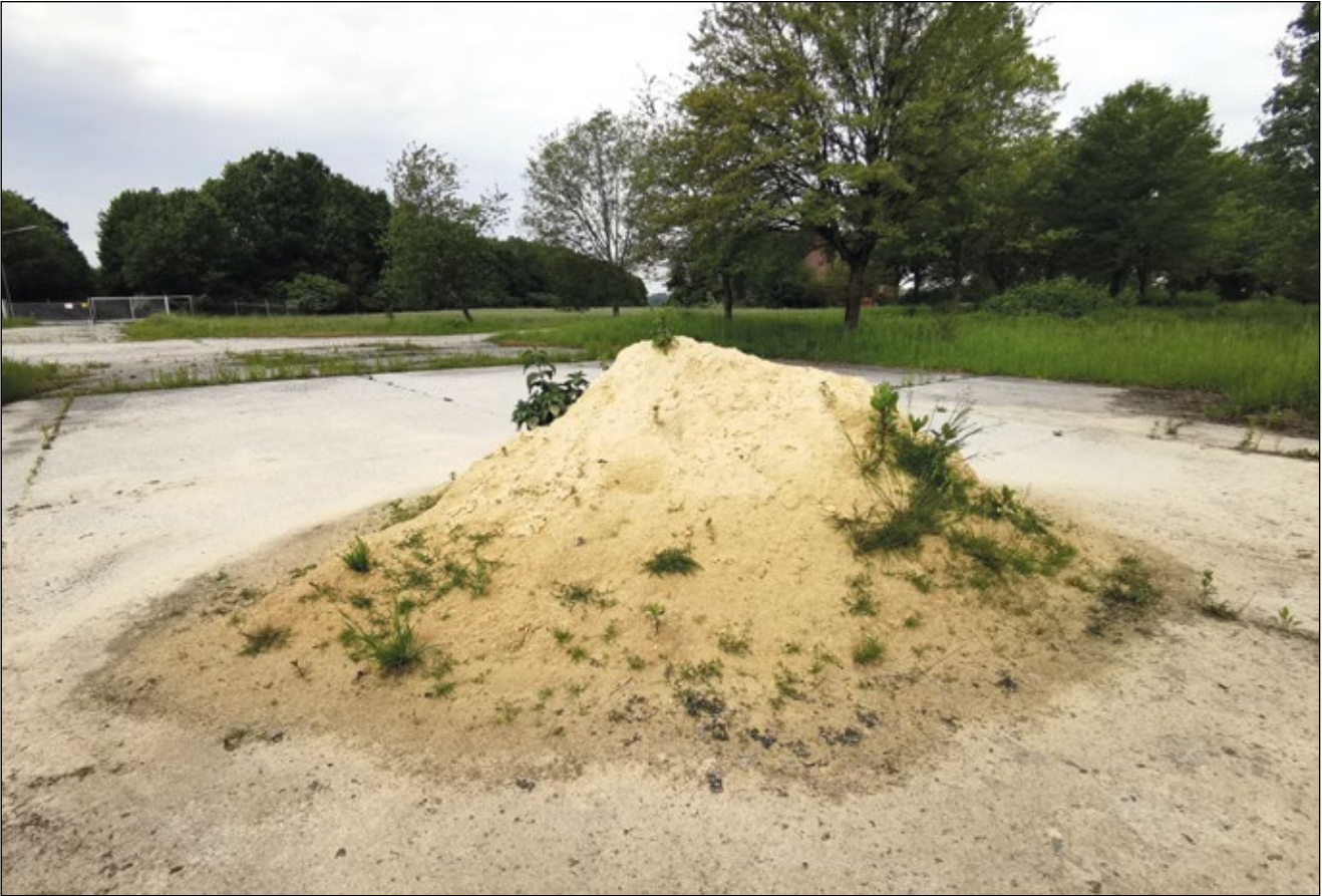
Abb. 30: „Bloß ein Sandhaufen!“ – auf dem Übungsgelände der früheren Kaserne Kirchham/Waldstadt in Niederbayern 2024 – kein Landeplatz für Hubschrauber mehr, sondern für friedliche Pflanzenpioniere

streicheln und Faustschläge versetzen, ist reizvoll. Allein zu beobachten, was auf einem nicht mehr benötigten Sandhaufen (Abb. 30) oder in der verwaisten Sandkiste mit der Zeit alles von selber wächst, ist verblüffend. Alles ist gratis, robust, wild, schön, von natürlicher Hand perfekt gestaltet ... nichts wird gehätschelt, getätschelt, gemäht, gegossen, mit Pestiziden künstlich am Leben erhalten oder penibel entfernt ... was wächst, wächst; was nicht wächst, das wächst halt nicht. Man sieht zu ... frei von Angst, Hysterie und Ordnungswahn ... geradezu mit buddhistischer Gelassenheit.