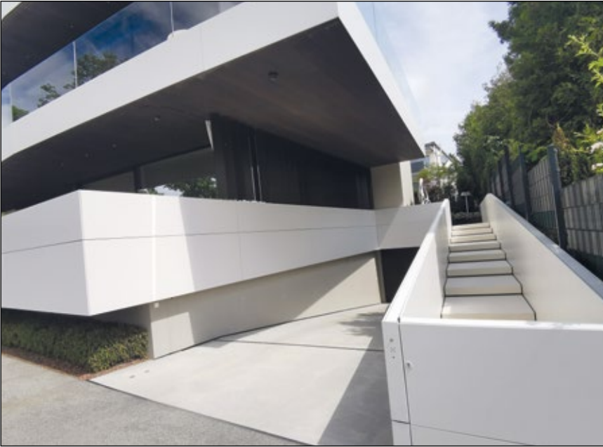
Abb. 8: Mondänes, puristisches Haus im Salzkammergut – Pflanzen spielen nur eine untergeordnete Rolle.