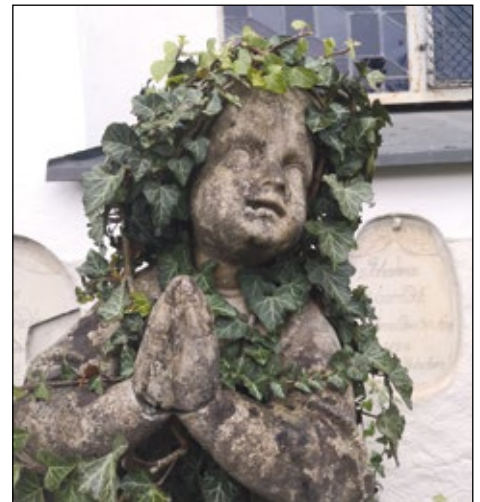
Abb. 20: Efeu statt Lorbeer – zärtlich umrankter Engel 2020 am Friedhof Obernberg am Inn