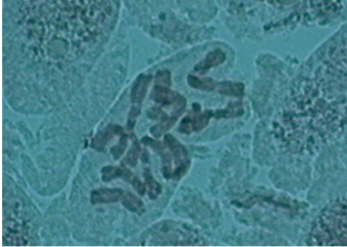
Abb. 1: Scilla vindobonensis . Metaphase einer Wurzelspitzenmitose ( 2n = 18 ). – Root mitosis (metaphase).

Sachsen: Elbsandsteingebirge, Elbaue bei Wehlen (5050/1); Frühjahr 2006, F. Müller. Ingo Uhlemann